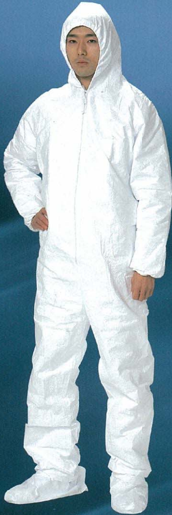
アゼアス® 1010B 続服

軽くて強い不織布の特徴を生かして、汚れの激しい作業および有害な粉じん、または、軽い水の飛沫に対するバリア性を要求される作業に適しています。